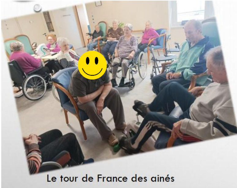
Le tour de France des aînés